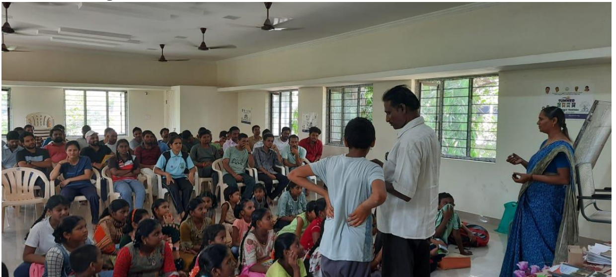
Motivation class on 24/05/2023